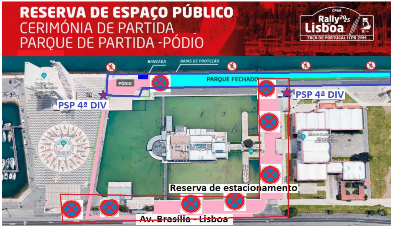
Imagem de apoio

apresentação dos veículos (ver imagem e apoio).